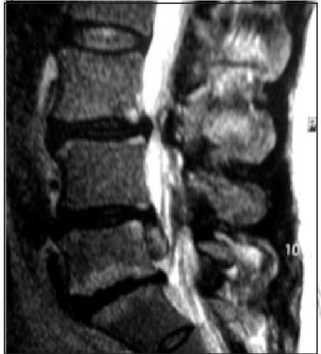
Fig. 1. IRM: voluminoso fragmento discal extruido, migrado y descendente L4/L5 derecho.

Al reintegrarse a los 2 meses a su actividad laboral, aparecieron los mismos síntomas. Recibió tratamiento