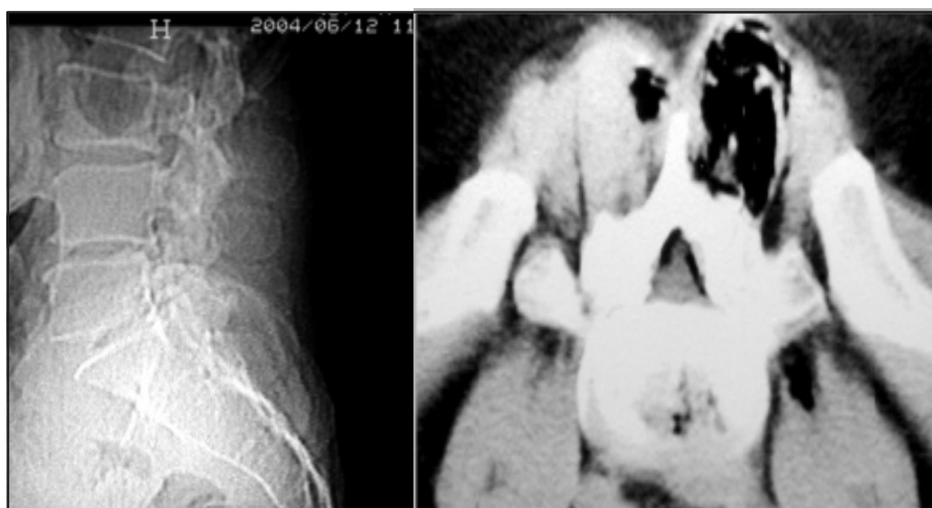
Fig. 3. TAC posterior a la aplicación de ozono, observándose O 3 en región muscular y peridural.

Los índices de recidivas de hernia de disco lumbar citados en la bibliografía, por diferentes autores se ubican entre el 3% y 19%, siendo los índices mas altos en series en el que el seguimiento fue mas prolongado 4 . El tratamiento inicial recomendado es el mismo que se indica para toda hernia de disco lumbar, debiéndose aplicar medidas no