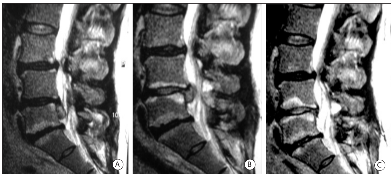
Fig. 4. IRM con gadolinio: A. Prequirúrgica. B. Postoperatoria a los 2 meses C. Postratamiento con O 3 a los 6 meses, con desaparición completa de su hernia y sin cambios inflamatorios

quirúrgicas siempre que el paciente no presente déficit neurológico progresivo, síndrome de cauda equina o dolor incoercible 5 .